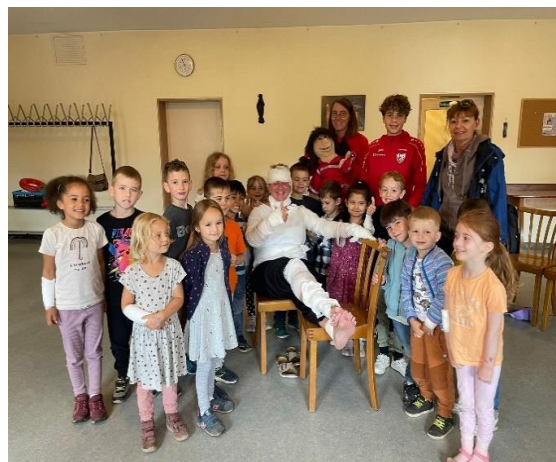
Kleine Hände- ganz groß. Wir sind bereit !