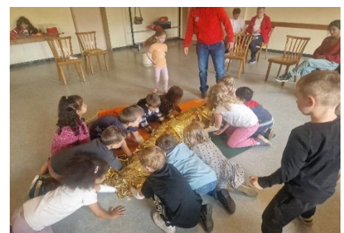
Maßnahmen im Notfall