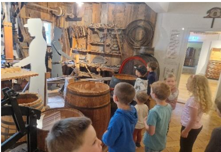
Unser Rundgang durch's Spessartmuseum war spannend und voller überraschender Abenteuer