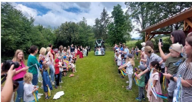
ALLES GUTE dem Brautpaar