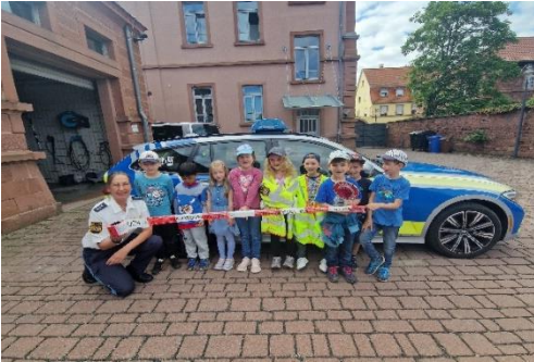
Ein spannender Tag auf der Wache