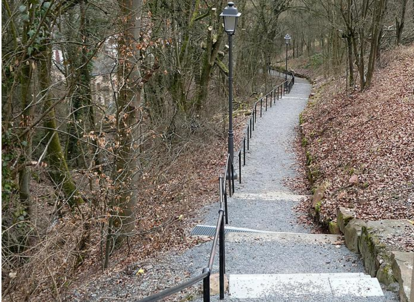
Der Stelzengraben ist saniert und nun auch beleuchtet.